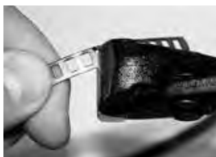
Этап 3 Удалить ненужную часть ленты. Во избежание травм удалить заусенцы с помощью напильника.