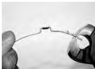
Этап 1 Придать хомуту нужную форму.

159 — исполнение с замком крючками наружу