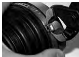
Этап 4 Поместить хомут на зажимаемую деталь. Зафиксировать крючки замка как можно плотнее в соответствующей прорези. С усилием обжать ушко с помощью клещей Oetiker.