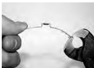
Этап 1 Придать хомуту нужную форму.

PG 159 — исполнение с замком крючками внутрь