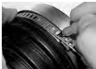
Этап 2 Определить необходимую длину хомута.