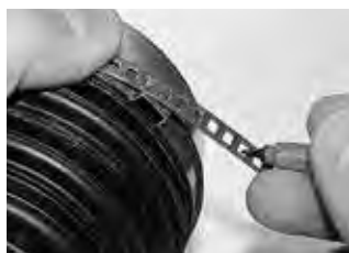
Этап 2 Определить необходимую длину хомута. Убедиться в том, что конец хомута проходит через ушко, как показано на изображении.