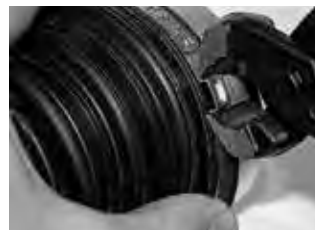
Этап 4 Поместить хомут на зажимаемую деталь. Зафиксировать крючки замка как можно плотнее в соответствующей прорези. С усилием обжать ушко с помощью клещей Oetiker.

PG 159 — исполнение с замком крючками внутрь